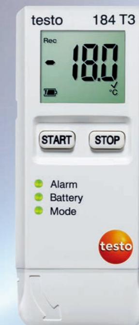
testo 184 USB型系列