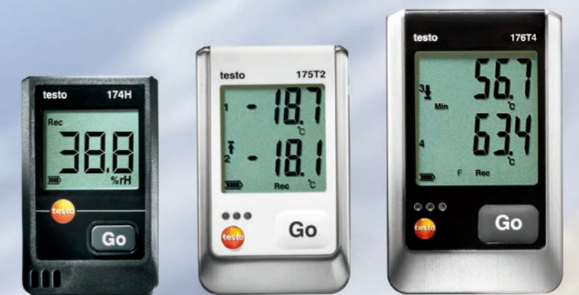
testo 174 迷你系列