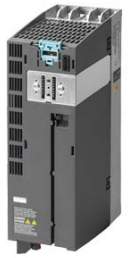
图像类似 / Figure similar