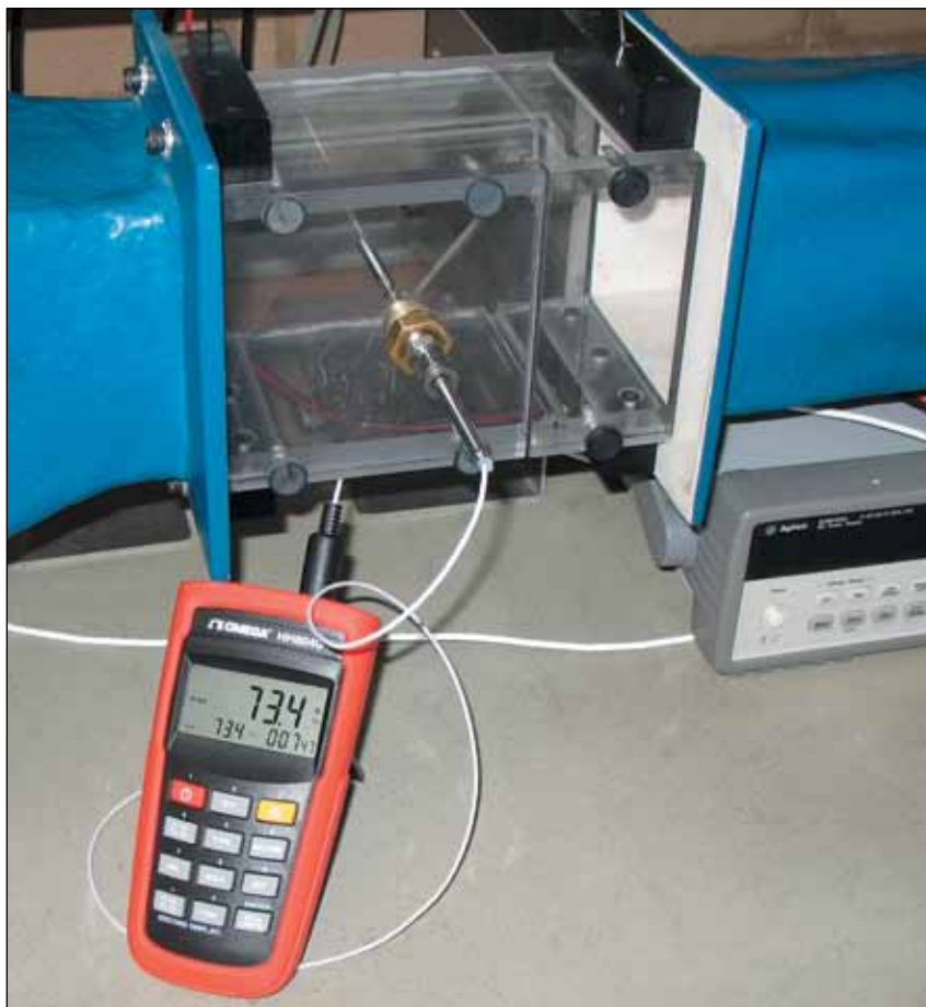
P-L-A-1/4-6-0-T-3, A级空气传感器，带可选的HH804U手持式仪表，图片小于实际尺寸。如需HH804U的更多信息，cn.omega.com/hh804U