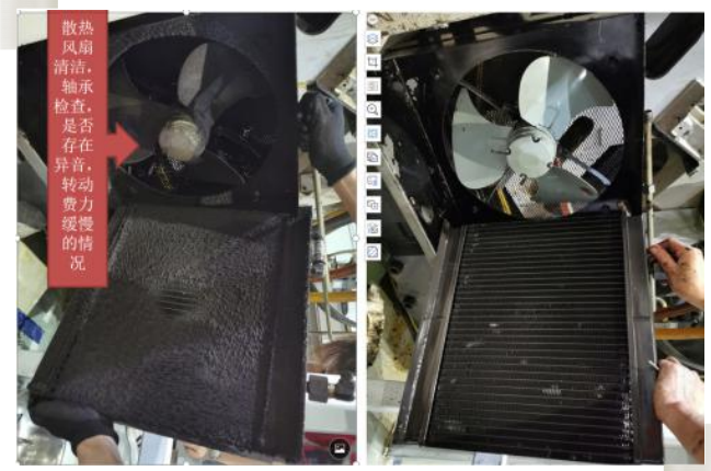
工作现场, 清洁整理维护现场进行中。