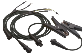
+ KC1 开尔文夹 3 m 导线