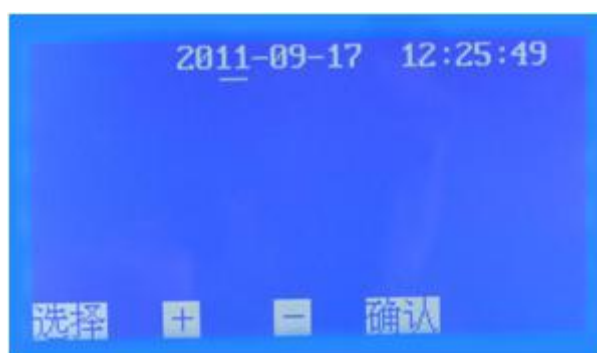
图 5 时间设置子页面

5. 在图 2 页面下，按 选择 键移动光标 √ 至 时间设置 处，按 确认 键即可进入 时间设置 子页面（图 5）。