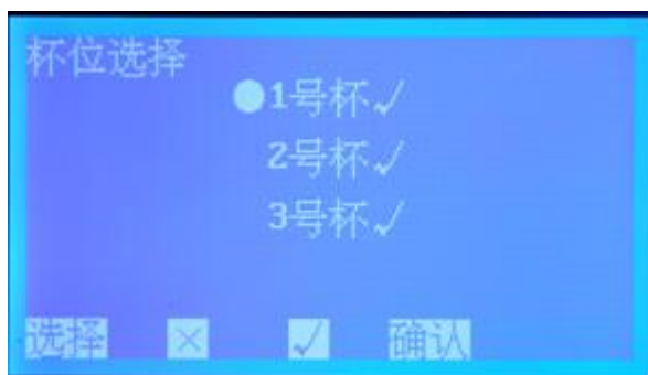
图 4 杯位选择子页面

在图 3 页面下，按 选择 键移动光标至 停升电压 ，按 + 或 - 键设置停升电压，其默认值是 60 kV，可选范围 10 kV~80 kV（增量 \Delta=10 kV）。选择好停升电压后，按 选择 键移动光标至 杯位选择 ，按 确认 键进入杯位选择子页面（图 4）。