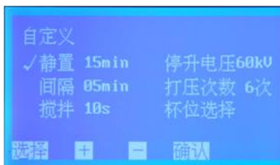
图 6 自定义设置子页面

6. 在图 2 页面下，按 选择 键移动光标 √ 至 自定义设置 处，按 确认 键即可进入 自定义设置 子页面（图 6）；