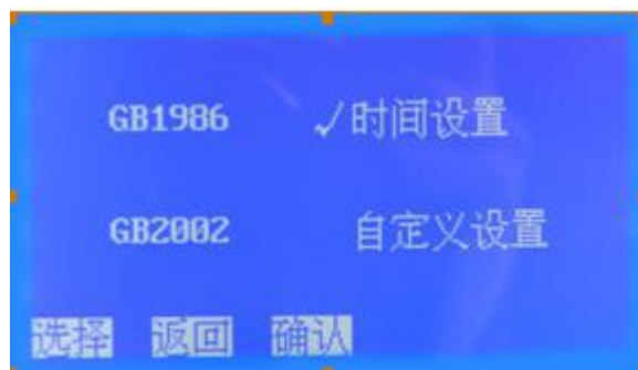
图 2 选择子页面