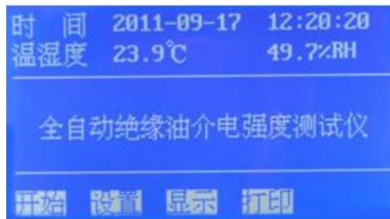
图 1 开机页面