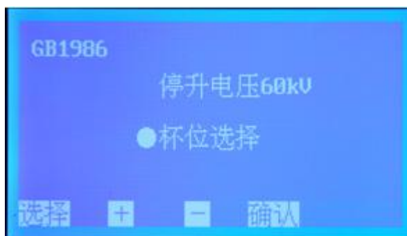
图 3 GB1986 子页面

在图 3 页面下，按 选择 键移动光标至 停升电压 ，按 + 或 - 键设置停升电压，其默认值是 60 kV，可选范围 10 kV~80 kV（增量 \Delta=10 kV）。选择好停升电压后，按 选择 键移动光标至 杯位选择 ，按 确认 键进入杯位选择子页面（图 4）。