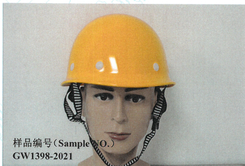
附件 A: 样品照片