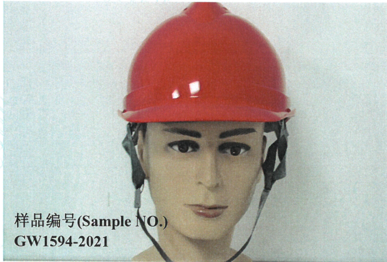
样品编号(Sample NO.) GW1594-2021